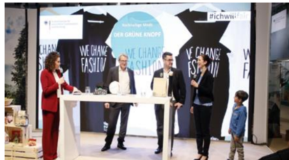
Internationale Grüne Woche, Januar 2020